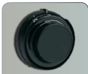
Fecho de Combinação