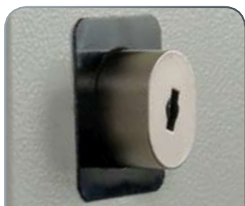
Fechadura com Chave

fechadura com 1 chave principal + 1 fecho de combinação + fechadura com 1 chave por gaveta