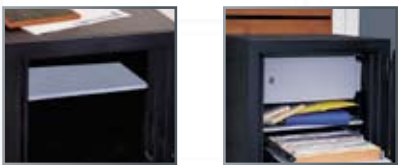
De gauche à droite : tablette, armoire intérieure