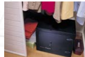
Complice s'accorde au mieux à votre environnement et peut être fixé au mur ou au sol grâce à son système de fixation